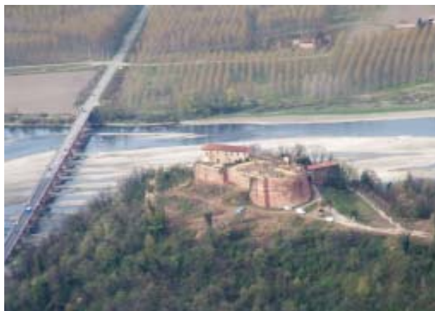
Vista aerea sul ponte di Crescentino e sul castello di Verrua S.