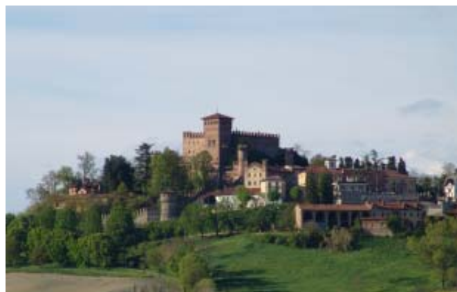
Il castello di Gabiano