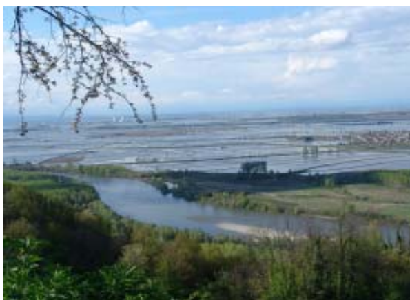
Le risaie vercellesi ed uno scorcio del Parco Fluviale del Po visti dalla strada Panoramica del Monferrato a Cantavenna