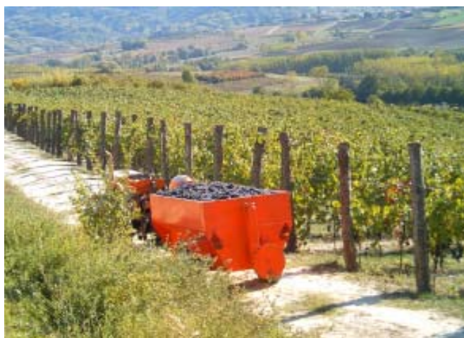
I vigneti della Cantina del Rubino

I 10 ettari di vigneto sono adagiati sulla catena delle colline del Monferrato che discendono verso il Po, in terreni posti ad un' altitudine che varia da 250 a 400 metri sul livello del mare, con buona esposizione al sole le vigne della Cantina del Rubino producono uve scelte, coltivate in modo tradizionale nel rispetto della natura e dell'uomo, e vinificate direttamente in azienda.