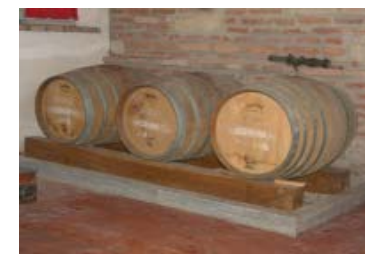
Le barriques di "Riserva del Vaslot"

La Cantina del Rubino è anche parte del Consorzio del Barbesino.