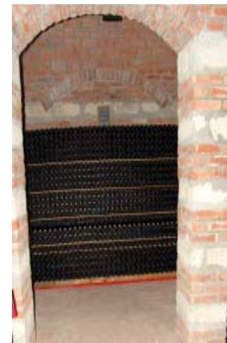
Bottiglie di Rubino ... invecchiano...

livello qualitativo dei vini e la sua modernizzazione permette di diversificare la produzione.