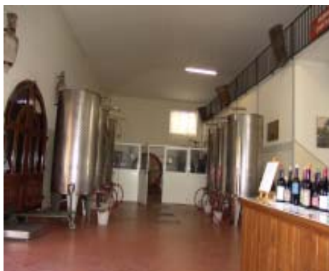
L'ingresso alla Cantina del Rubino

Oggi, fortemente legata alla tradizione del territorio ma affiancata dalle nuove tecnologie, a conduzione familiare, è costantemente impegnata a migliorare il