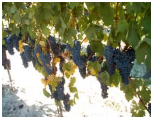
Grappoli di Barbera

Attualmente il quantitativo di vino prodotto si aggira sulle 40.000 bottiglie e si possono contare circa 20 diverse preferenze di vino offerte al pubblico tra sfuso ed imbottigliato: dai prodotti da tavola alla "Riserva